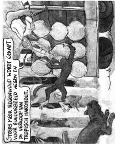
STEDS MEER REGENWOUID WORDT GERAPT VOOR BLIJVOEREND WEGEN EN DE VERMOED VAN TROPISCH HAROHOUT.