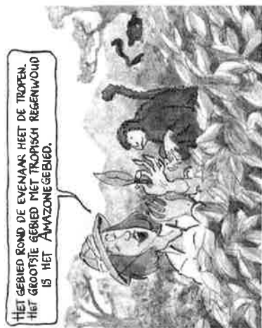
HET GEBIED ROND DE EVENARER HEET DE TROPEN. HET GROOTSTE GEBIED MET TROPISCH REGENWOUID IS HET AMAZONEGEBIED.