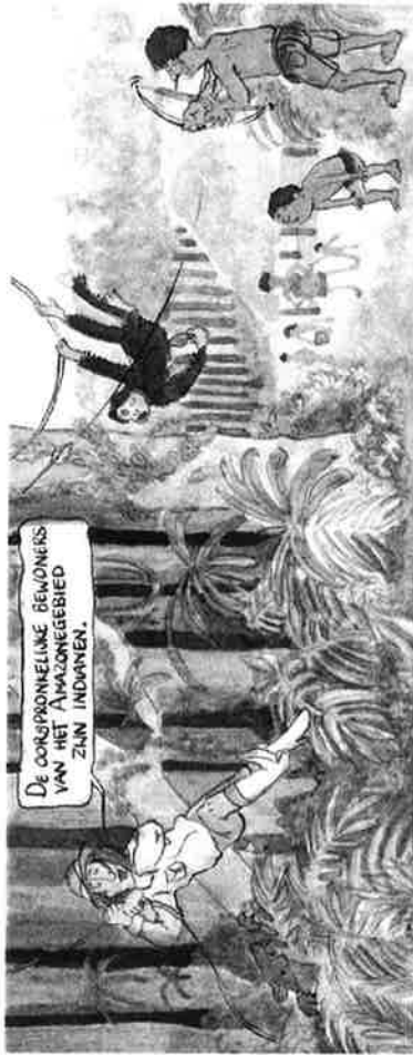
DE OORSPRONKELIJKE BEWONERS VAN HET AMAZONEGEBIED ZIJN INDIËNEN.