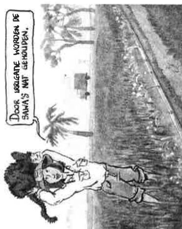
DOOR VERLEGATE WORDEN DE SAMA'S NIET GEHOUDEN.