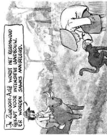
IN ZUIDOOST-AZIË WORDT HET REGENWOUID GERAPT VOOR INTENSIEVE LANDBOUW. ER WORDEN SAMA'S AANGELEGD.