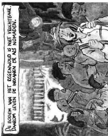
DE BODEM VAN HET REGENWOUID IS NIET VERLICHTBAAR. DAWOOR LEVEN DE INDIËNEN ER ALS NOMADEN.