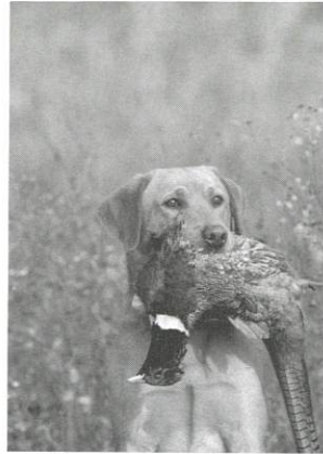
Een hond heeft een goede neus. Daarmee ruikt hij zijn prooi.

groeit hier de nieuwe plant uit. Sommige planten gaan dood. Maar uit hun zaden groeien nieuwe plantjes.